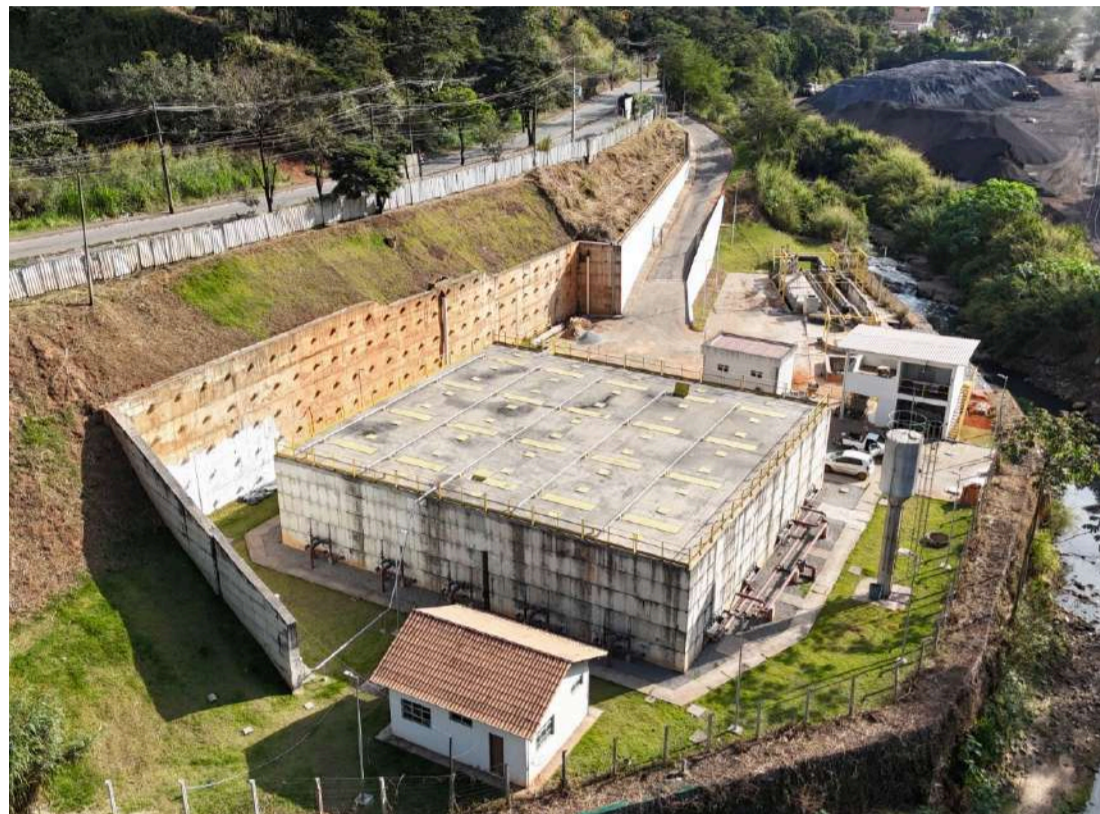
ETE CARNEIRINHOS: obra vai tratar cerca de 60% do esgoto da cidade

SEGUNDO A PREFEITURA, ESSA É UMA DAS MAIORES OBRAS DE SANEAMENTO DA HISTÓRIA DA CIDADE