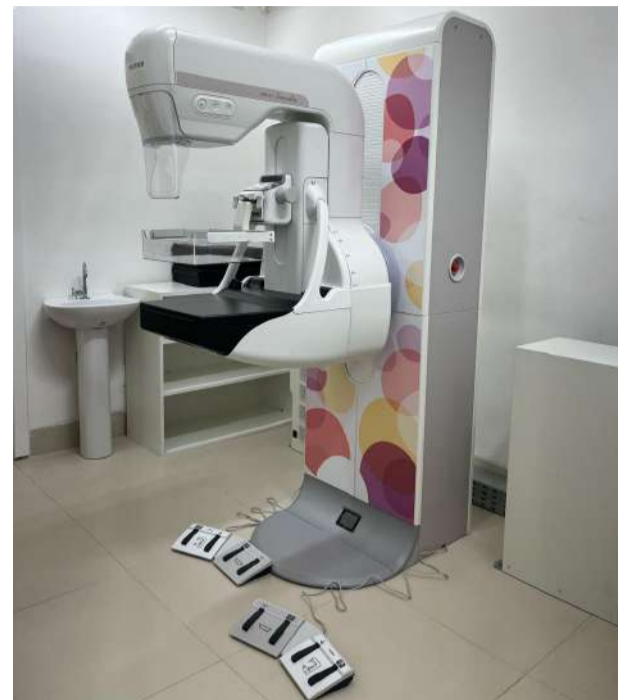
PREFEITURA de São Gonçalo do Rio Abaixo entrega novo mamógrafo digital e amplia acesso a exames no município

Segundo a Prefeitura, o novo serviço também irá fortalecer a estrutura do Hospital Municipal de São Gonçalo e ampliar a autonomia da rede pública de saúde do município na realização de exames especializados.