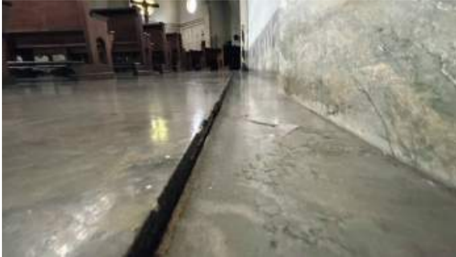
O INTERIOR da igreja já têm desnível visível devido a movimentação do solo