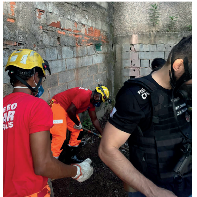
CORPO foi encontrado em cova rasa

Os agentes ainda apreenderam 27 pedras de crack, R$14,00 em dinheiro e dois telefones celulares danificados. Os presos e todo o material foram remetidos à Delegacia de Polícia Civil para as providências legais.