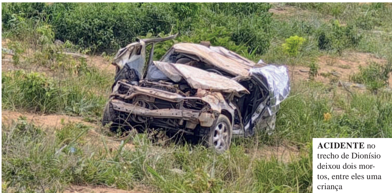
ACIDENTE no trecho de Dionísio deixou dois mortos, entre eles uma criança

O impacto do capotamento foi fatal para dois dos ocupantes do veículo, um homem adulto e uma criança, que morreram ainda no local. A terceira ocupante, uma mulher, foi resgatada com vida por equipes do Serviço de Atendimento Móvel de Urgência (Samu). Ela sofreu um Traumatismo Cranioencefálico (TCE) e foi transferida com urgência para o Hospital Márcio Cunha (HMC), em Ipatinga.