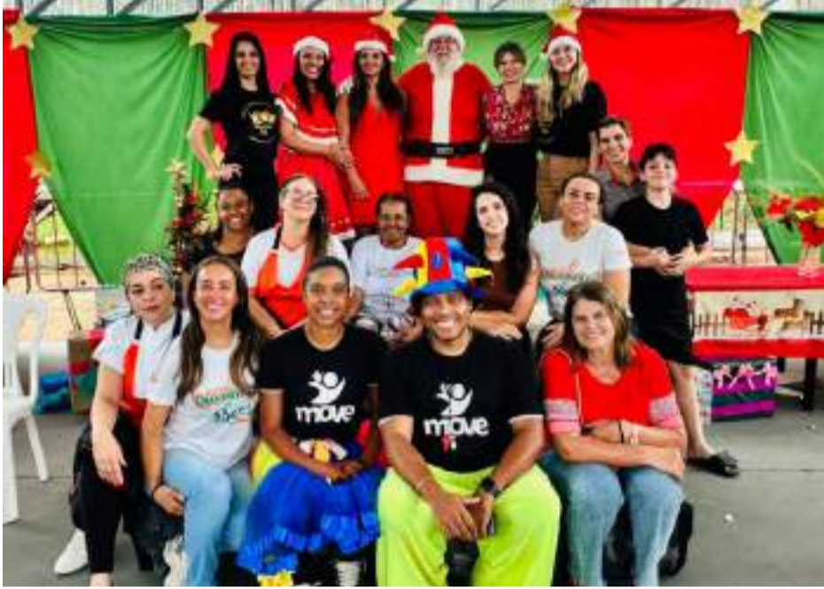
VOLUNTÁRIOS , ao lado do Papai Noel, levando alegria, carinho e esperança para tornar este Natal ainda mais especial

O espírito natalino tomou conta da Escola Municipal Monteiro Lobato na última quarta-feira (17). Localizada na rua Nova York, no bairro Novo Cruzeiro, em João Monlevade, a instituição ganhou um almoço