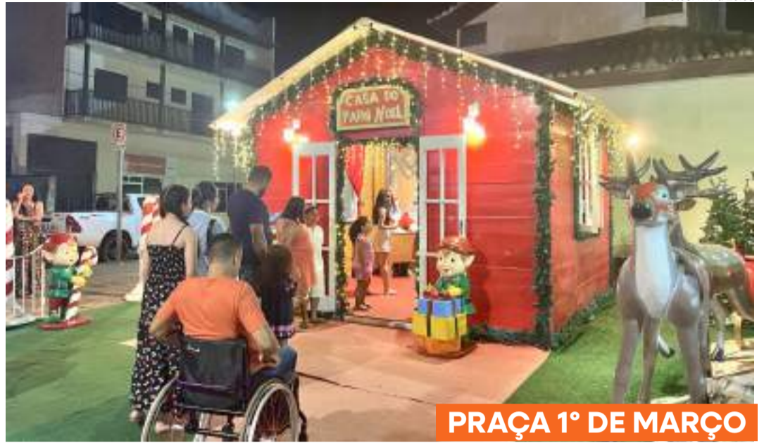
PRAÇA 1º DE MARÇO