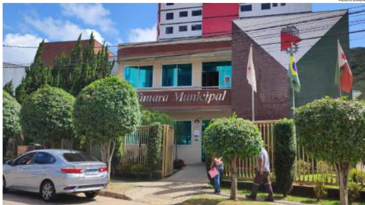
CÂMARA de João Monlevade aprova orçamento de R$533 milhões e define metas até 2029, com investimentos em saúde, educação, infraestrutura e cultura

Com a previsão de um orçamento de R$533 milhões para o exercício de 2026, a Câmara de João Monlevade aprovou, na última reunião ordinária de 2025, na quarta-feira (17), os principais instrumentos de planejamento financeiro do município. Foram votados o Plano Plurianual (PPA 2026–2029), o Anexo de Metas e Prioridades da Lei de Diretrizes Orçamentárias (LDO) e a Lei Orçamentária Anual (LOA).