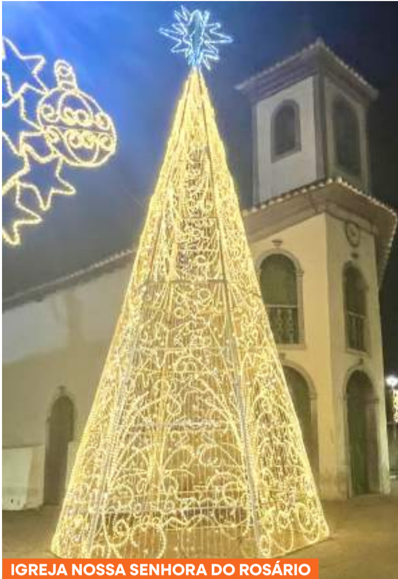
IGREJA NOSSA SENHORA DO ROSÁRIO