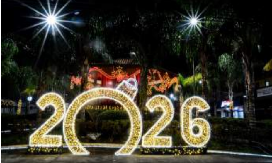
PRAÇA SETE DE SETEMBRO