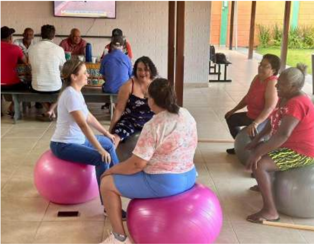
CAMPS reúne equipe especializada para melhor atendimento aos pacientes