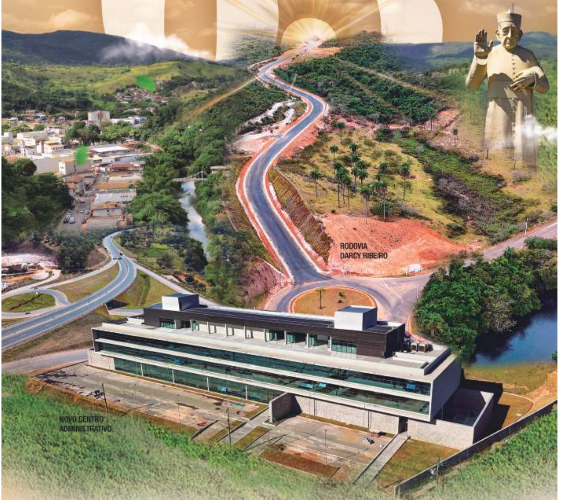
RODOVIA DARCY RIBEIRO