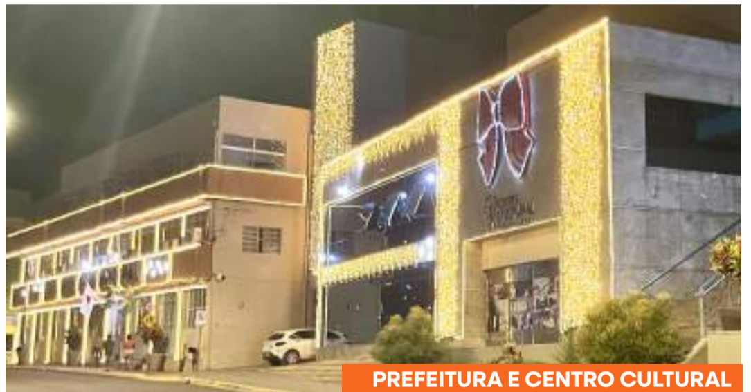
PREFEITURA E CENTRO CULTURAL

Neste fim de ano, a AMEPI reforça seu compromisso com a integração e o fortalecimento dos municípios do Médio Piracicaba .