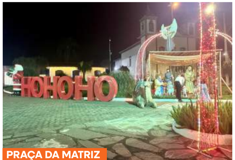
PRAÇA DA MATRIZ