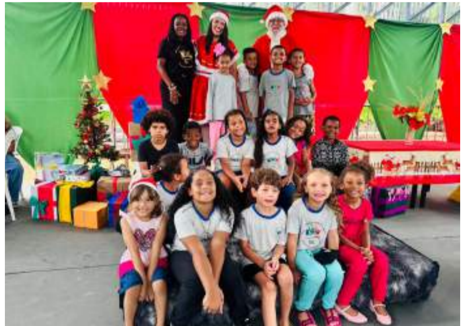
SORRISOS que traduzem o verdadeiro espírito natalino. As crianças da Monteiro Lobato celebrando um momento de encanto, alegria e sonhos que se renovam