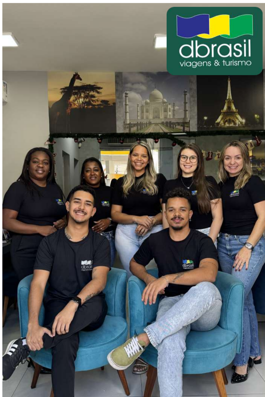
EQUIPE DBRASIL: atendimento aos clientes com experiência e dedicação

A expectativa é de grande movimento na agência, reunindo pessoas que sonham em viajar com segurança, organização e condições imperdíveis.