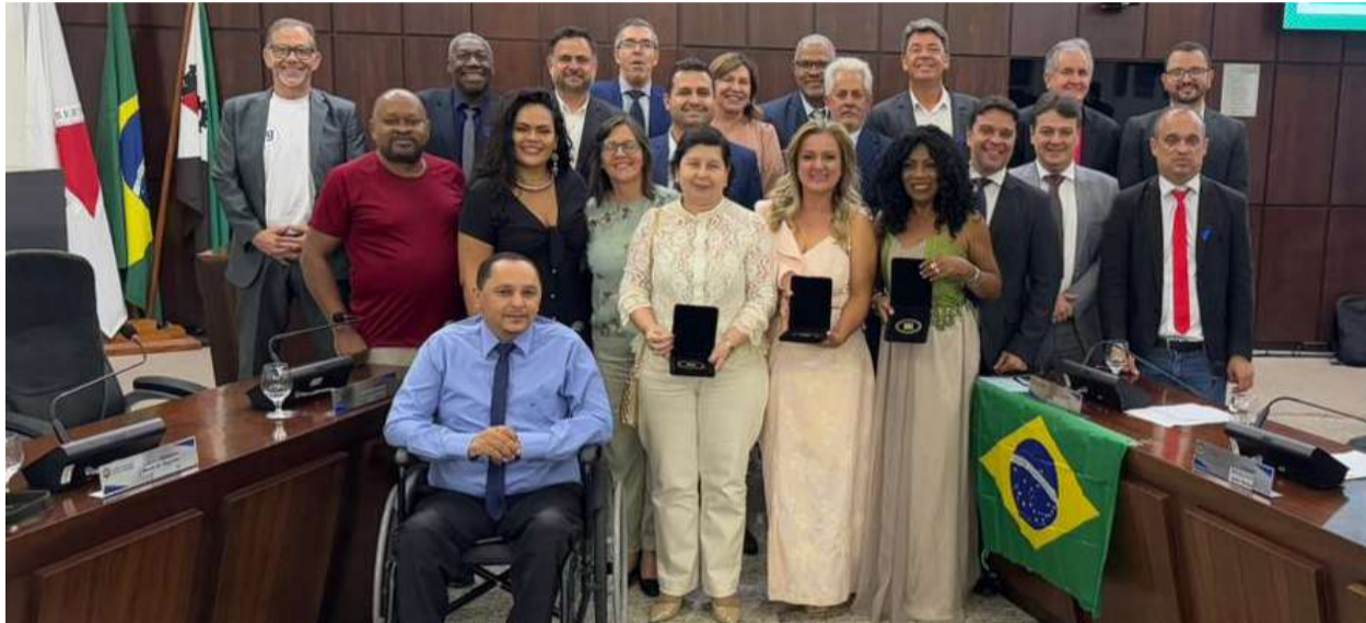
HOMENAGEADAS em foto oficial com os vereadores e autoridades locais