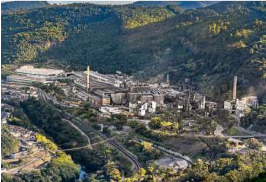
USINA de Monlevade continuará recebendo investimentos em tecnologia e modernização

AOS 90 ANOS, UNIDADE É CONSIDERADA ESTRATÉGICA, PRODUTORA DE AÇOS ESPECIAIS E DE ALTO VALOR AGREGADO