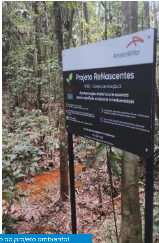
Recuperação de nascentes é o objetivo do projeto ambiental

Para fazer a revegetação, serão utilizadas espécies nativas nas áreas, promovendo a recomposição original e fortalecendo os ecossistemas locais. As nascentes são o ponto de partida para o ciclo da água, originando rios que abastecem as cidades, irrigam plantações e sustentam a biodiversidade. O trabalho de preservação é fundamental para assegurar água potável e equilíbrio ambiental para as futuras gerações.