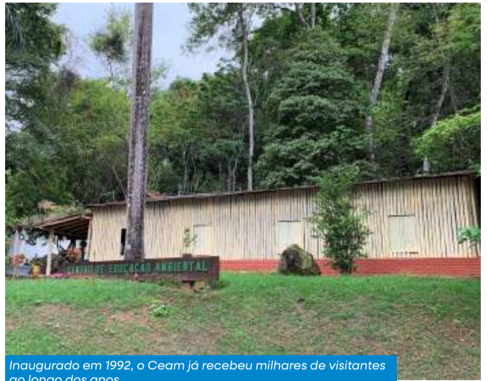
Inaugurado em 1992, o Ceam já recebeu milhares de visitantes ao longo dos anos

O Ceam é uma referência em preservação do