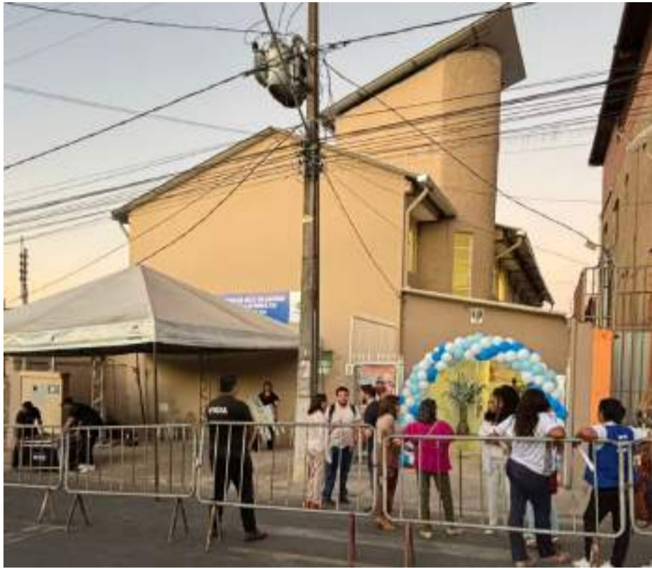
João Vitor Simão

PRÉDIO da UBS Novo Cruzeiro foi totalmente remodelado, com mais acessibilidade e conforto aos usuários