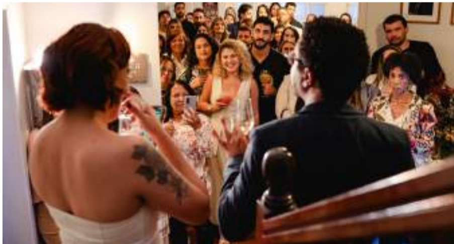
CASAL de fotógrafos recebeu clientes e amigos em noite de festa

ra, a Fala das Imagens recomeça, mas com a mesma essência: transformar cada ensaio especial em algo que faz parte da história das pessoas. A empresa oferece planos mensais para vários tipos de ensaios fotográficos, bem como oficinas e cursos para profissionais que desejam se aperfeiçoar. “Nossa casa está aberta. E se você quiser viver esse recomeço junto com a gente”, convidam. O novo estúdio está localizado na Avenida Alberto Lima, 311, Aclimação.