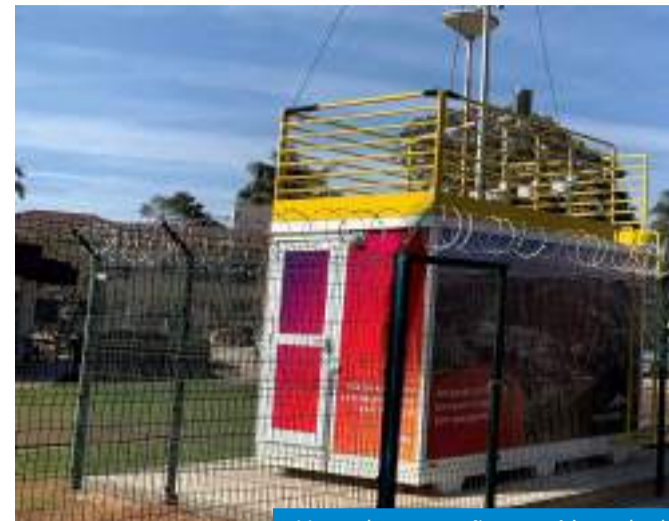
Uma das estações está instalada

Desde setembro de 2024, João Monlevade mantém em funcionamento dois instrumentos de acompanhamento da qualidade do ar. A ArcelorMittal instalou duas Estações Automáticas de Monitoramento da Qualidade do Ar, nos bairros Vila Tanque e Centro Industrial, em locais definidos pelo Núcleo de Qualidade do Ar da Fundação Estadual do Meio Ambiente (Feam).