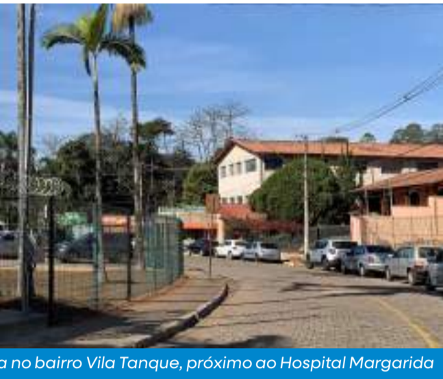
...a no bairro Vila Tanque, próximo ao Hospital Margarida