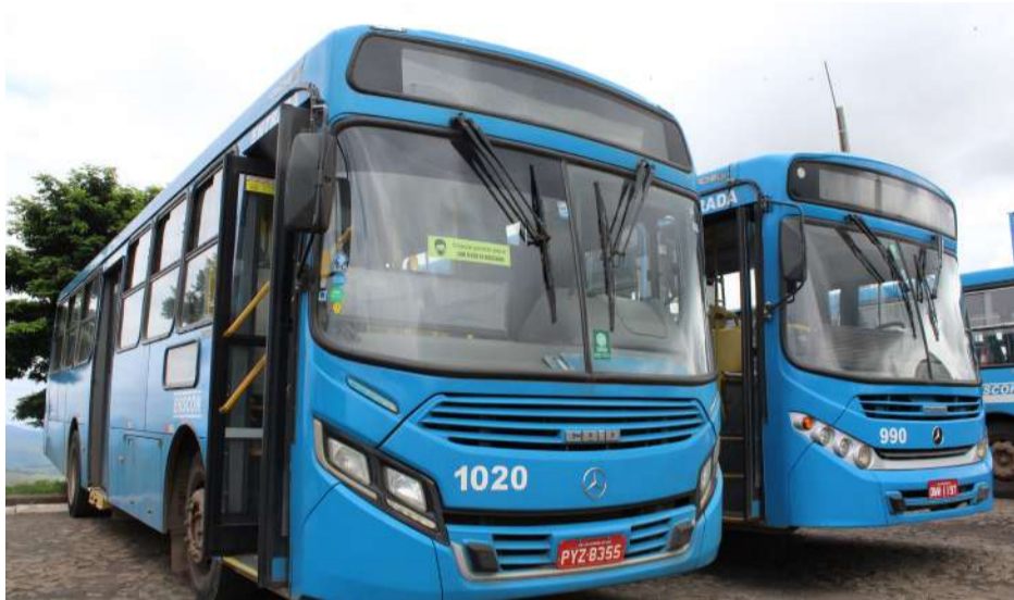
ACOM/PMJM-Sérgio Henrique Braga

CONGELAMENTO DAS PASSAGENS FOI POSSÍVEL POR AUMENTO DO NÚMERO DE PASSAGEIROS, QUE PERMITIU REDUÇÃO NA TARIFA TÉCNICA