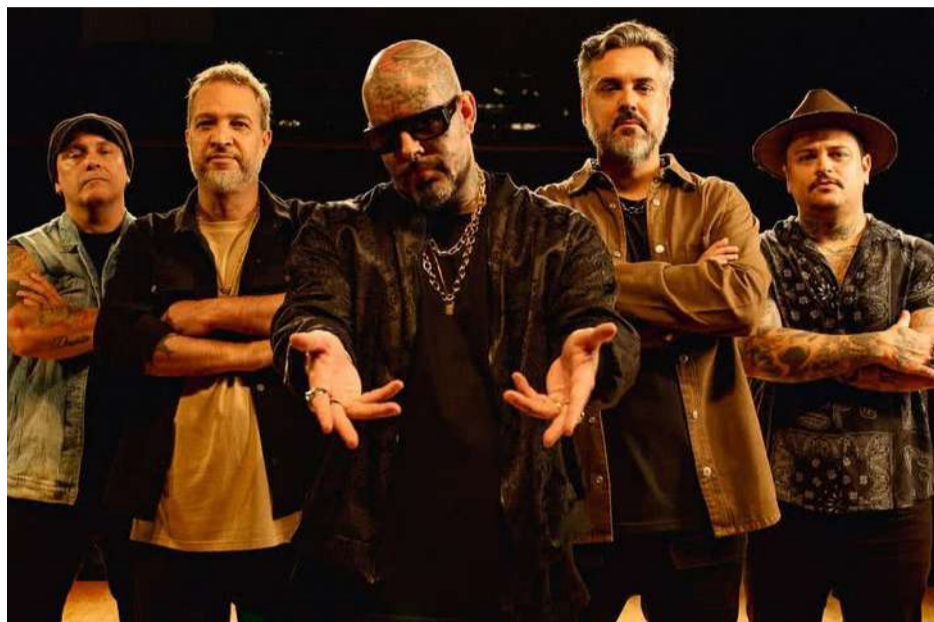
A BANDA Detonautas sobe ao palco na noite de amanhã às 21h

MUMUZINHO, DETONAUTAS E ROUPA NOVA ESTÃO ENTRE OS SHOWS DO FIM DE SEMANA