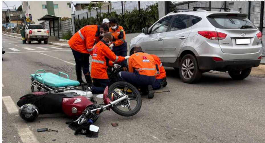
EQUIPE do Sevor faz atendimento a vítima de acidente no bairro Sion

ENTRE NOVEMBRO DE 2024 E O INÍCIO DE JULHO DESTE ANO, FORAM 188 OCORRÊNCIAS DE ACIDENTES COM MOTOCICLETAS