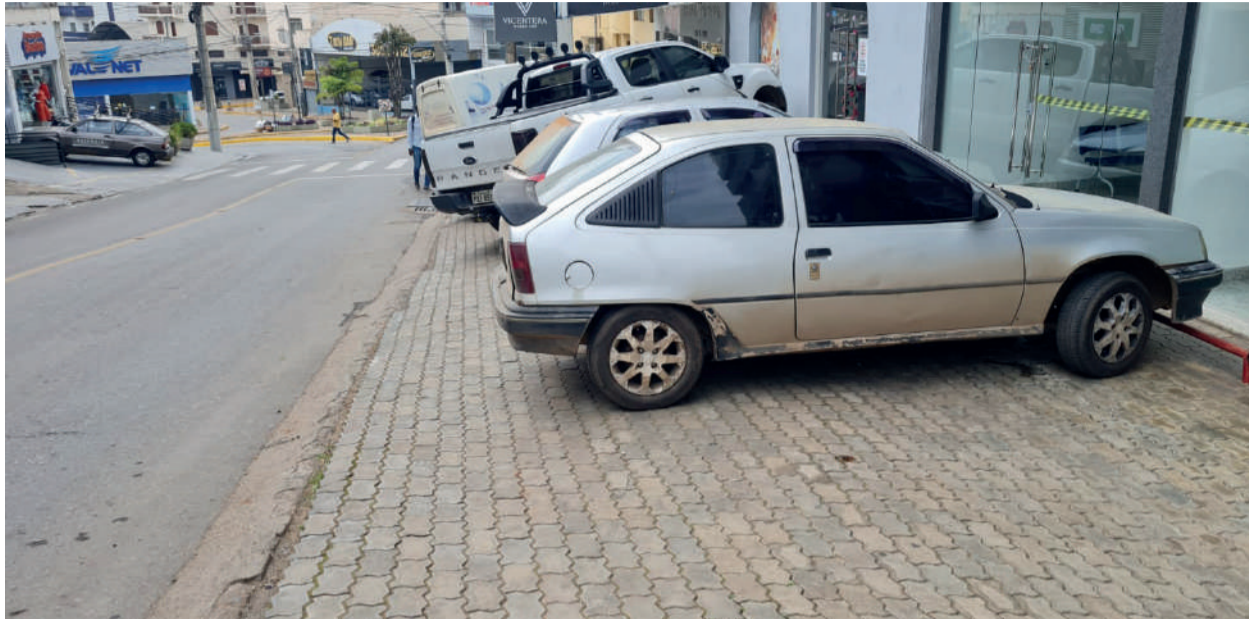
ESTACIONAMENTO de veículos sobre os passeios é cena constante em Monlevade