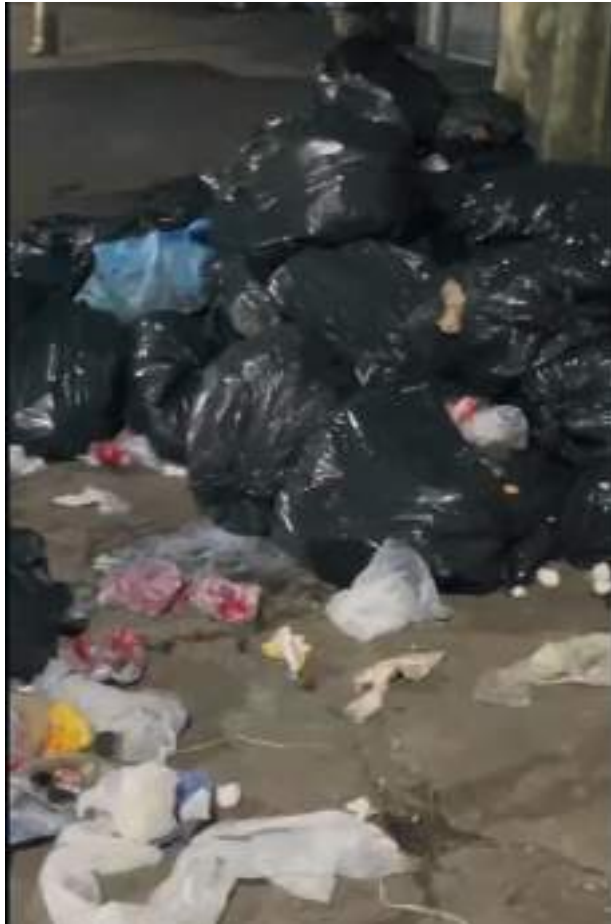
Reprodução SACOS abandonados sobre calçada, muitos rasgados, espalhando lixo pela Armando Fajardo

SEGUNDO A PREFEITURA, O CRONOGRAMA DO RECOLHIMENTO ESTÁ SENDO SEGUIDO NORMALMENTE