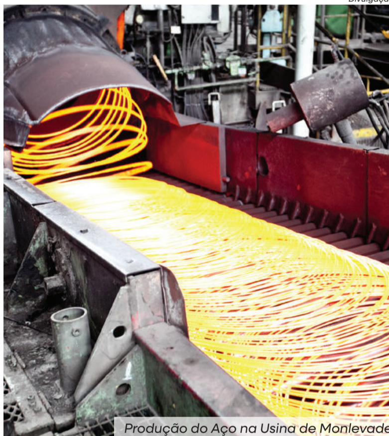
Produção do Aço na Usina de Monlevade