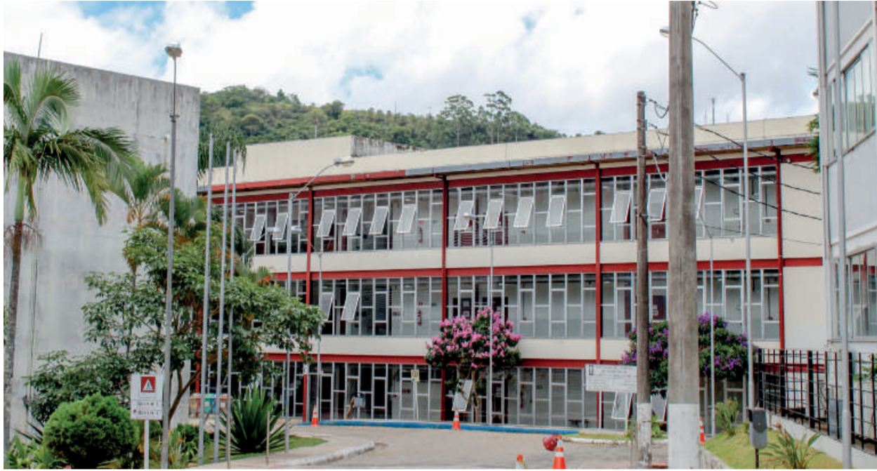
CAMPUS DA UFOP MONLEVADE: local oferece cursos na área de exatas