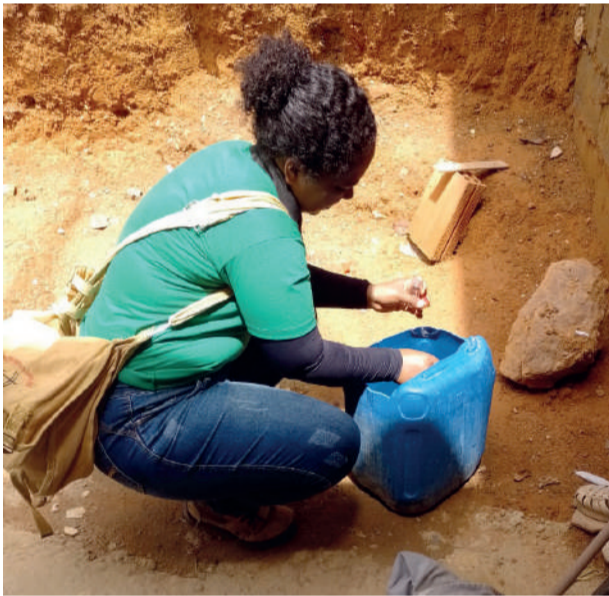
AGENTES DA VISA vistoriam locais propícios ao mosquito transmissor da dengue

A Prefeitura de João Monlevade, por meio da Secretaria Municipal de Saúde e da Vigilância em Saúde (Visa), segue com diversas ações em combate à dengue no município. Na manhã do próximo sábado (1º), uma equipe de agentes de endemias da Visa executará mais uma etapa de vistorias em imóveis, dessa vez no bairro Sion.