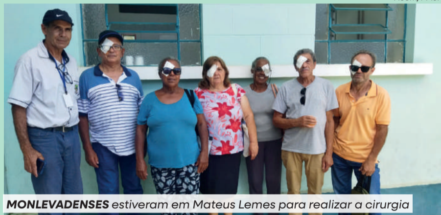
MONLEVADENSES estiveram em Mateus Lemes para realizar a cirurgia

Mais 26 cirurgias de catarata foram realizadas em monlevadenses, através de um mutirão no último domingo (19). O procedimento foi feito na cidade de Mateus Leme. A exemplo de outros mutirões, a Prefeitura de João Monlevade disponibilizou toda a estrutura para a realização das cirurgias, com exames, transporte, alimentação para os pacientes e acompanhamento de servidores.