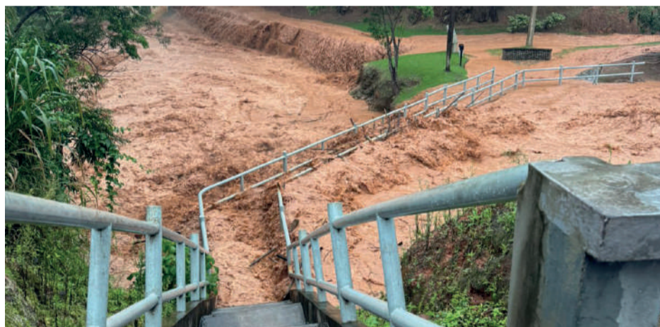
CÓRREGO do mingau transbordou com a força das chuvas