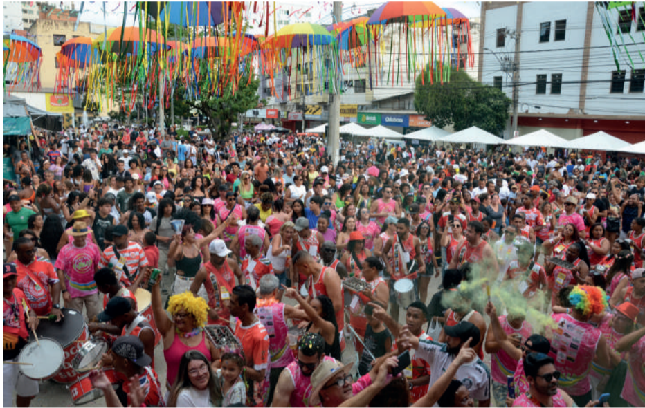
Acom - PMJM

PRÉ-CARNAVAL Esquenta Monlé atrai diversos foliões na região central