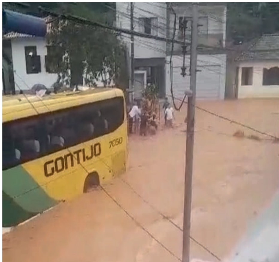
PARTE da região central ficou alagada

Na nota, a Prefeitura de Dom Silvério “expressa sua profunda gratidão a todos que estão colaborando direta ou indiretamente para superar este desafio. Reforçamos que a união de esforços é essencial para reconstruir o município e devolver esperança às famílias atingidas”.