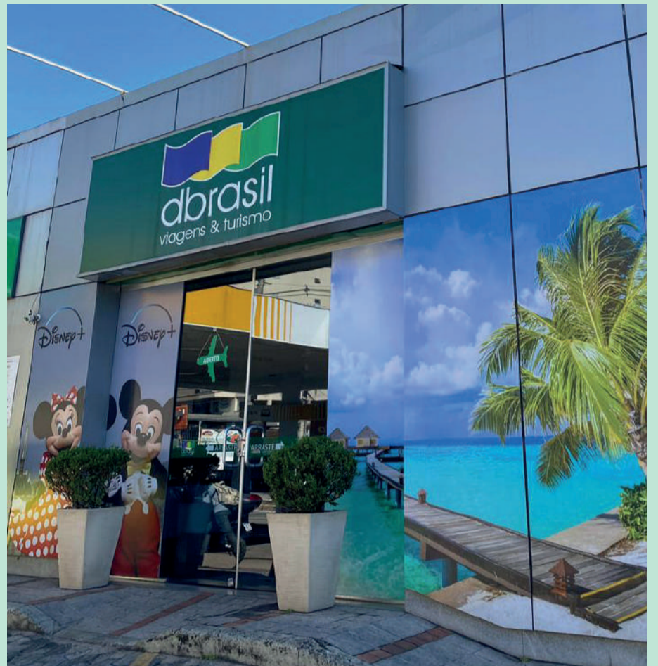
Divulgação DBRASIL Viagens Monlevade: viagem dos sonhos, com toda a assessoria que você merece

Na Dbrasil, não são vendidas apenas viagens, mas sim oferecidas experiências. A assessoria é completa: do planejamento inicial até o retorno da viagem. A equipe ajuda você a escolher os melhores destinos, fazer as reservas e até mesmo planejar atividades durante sua estadia. Com a ajuda da Dbrasil, você pode se concentrar apenas em aproveitar, sem se preocupar com imprevistos ou detalhes logísticos.