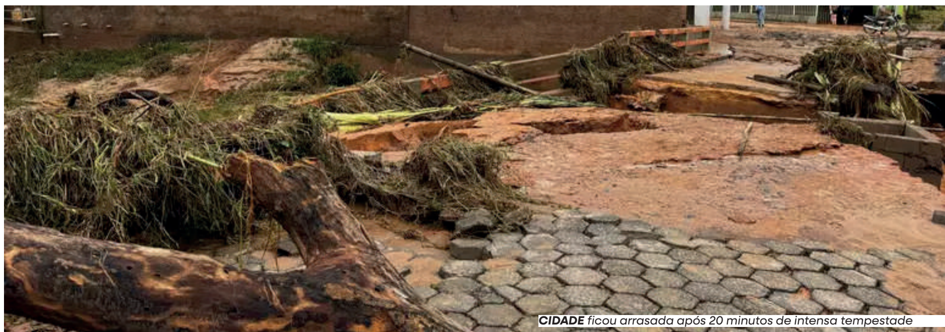
CIDADE ficou arrasada após 20 minutos de intensa tempestade