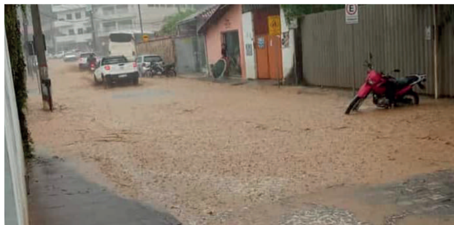
RUAS ficaram alagadas após temporal