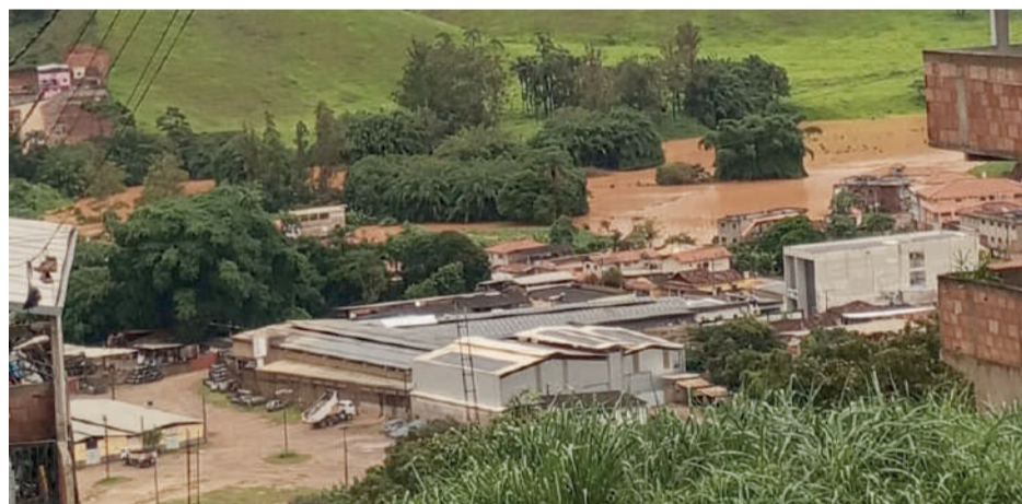
CHUVA causou transtornos e prejuízos na cidade