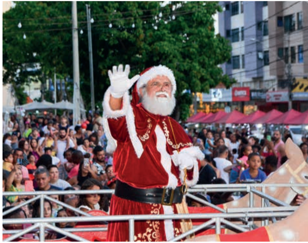
PAPAÍ NOEL será o destaque e terá momentos de fotos com as crianças

A magia do Natal invade João Monlevade neste domingo (24), com o acendimento oficial das luzes natalinas na Praça do Povo, a partir das 18h - no Natal de Luz 2024. O evento vai emocionar o público com apresentações musicais imperdíveis. A programação é um convite para todas as idades.