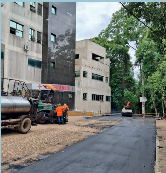
Acom/PMJM-Sérgio Henrique Braga

ASFALTAMENTO vai ampliar número de vagas de estacionamento no local