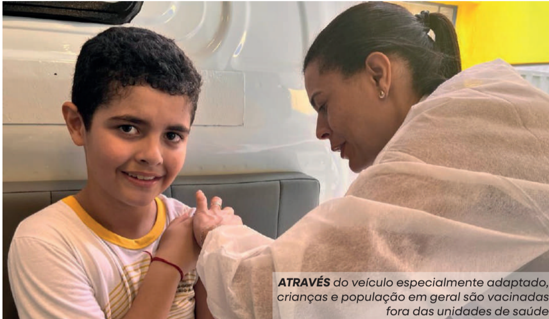
ATRAVÉS do veículo especialmente adaptado, crianças e população em geral são vacinadas fora das unidades de saúde

A Secretaria de Saúde da Prefeitura de São Gonçalo do Rio Abaixo promove, até o dia 29 de novembro, a atualização do cartão vacinal através do Vacimóvel. O veículo é especialmente adaptado para realizar vacinações fora das unidades de saúde do município, levando doses de proteção diretamente à população em locais estratégicos, como escolas e praças.