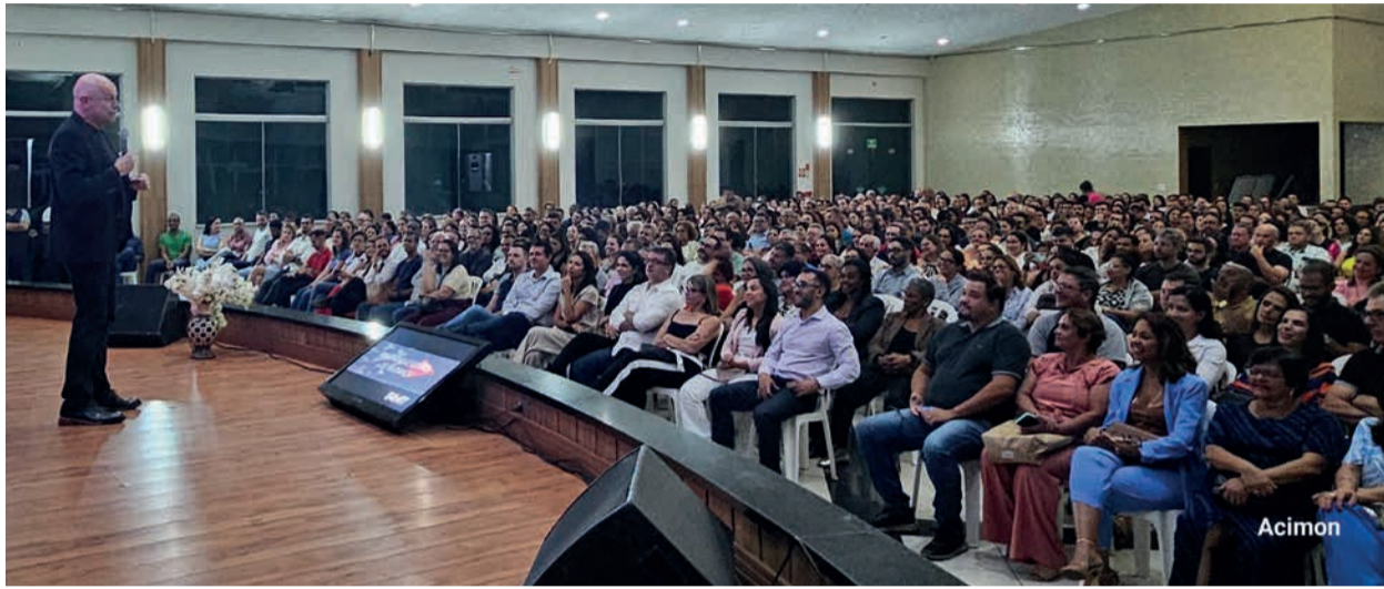
PÚBLICO atento à palestra do historiador e professor renomado, Leandro Karnal

EVENTO COMEMOROU 60 ANOS DA ENTIDADE E FOI SUCESSO COM PALESTRANTES RENOMADOS