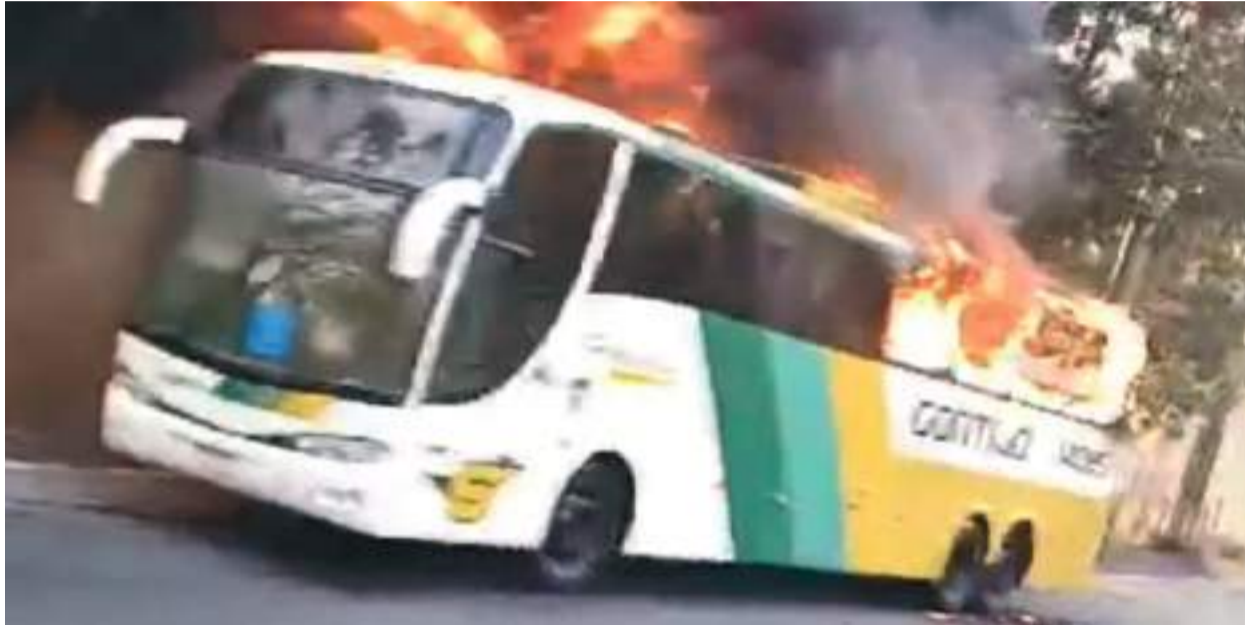
AS CHAMAS começaram, na parte traseira, e depois consumiram todo o ônibus