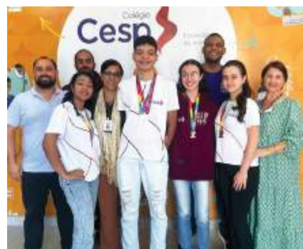
ALUNOS medalhistas junto a professores de Matemática, equipe pedagógica e direção do Colégio Cesp

Os alunos do Colégio Cesp mostraram mais uma vez seu talento e dedicação ao conquistarem diversas premiações na Olimpíada Brasileira de Matemática (Obmep). A competição, que é uma das mais importantes do país, visa estimular o estudo da Matemática e revelar novos talentos na área.