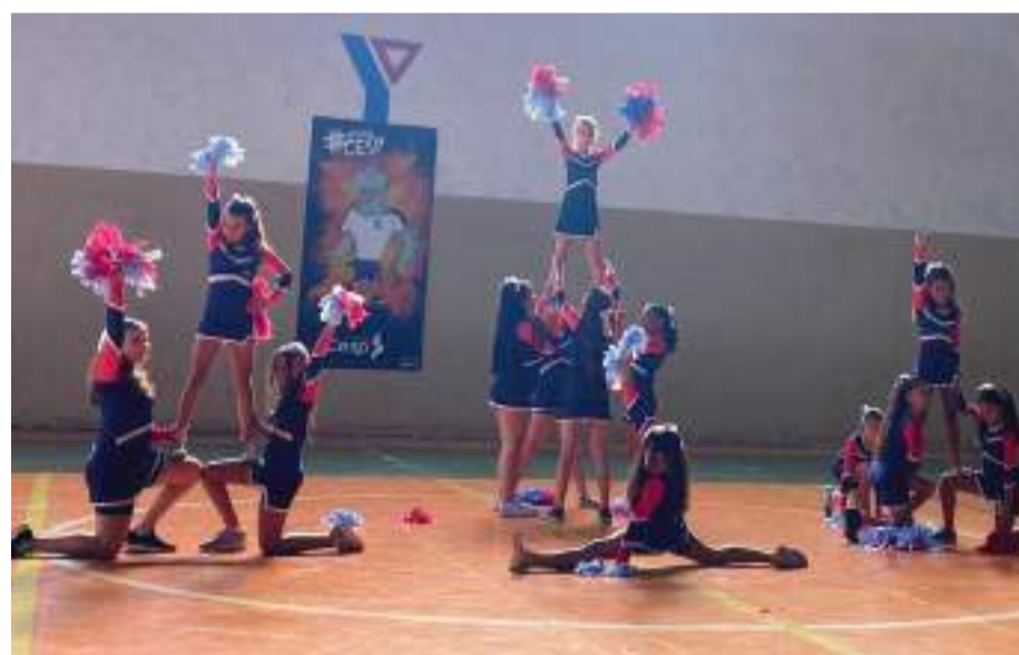
A ABERTURA dos jogos foi abrilhantada pelas “teen líderes”, grupo de líderes de torcidas

Dias de muita alegria e diversão numa competição bastante saudável, nas dependências do Colégio Cesp. Assim foram os Jogos Interclasses, realizados em meados de julho, e que coincidiram com os últimos dias da Gincana Estudantil da escola. A abertura dos jogos foi abrilhantada, pelo segundo ano consecutivo,