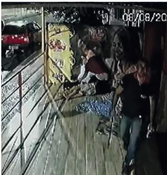
MORADOR de rua espancado não quis representar contra agressores

TENTATIVA DE EXTORSÃO TERIA MOTIVADO SURRA