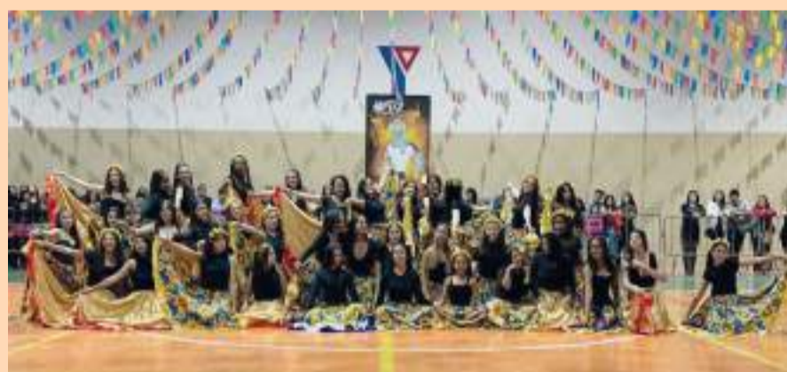
PERFORMANCES artísticas envolveram alunos de todas as séries

No dia 17 de agosto, o Colégio Cesp promoveu a 14ª edição do Forrobodó, um evento que se consolidou como uma tradição na escola, celebrando a cultura, a integração e a alegria de sua comunidade escolar.