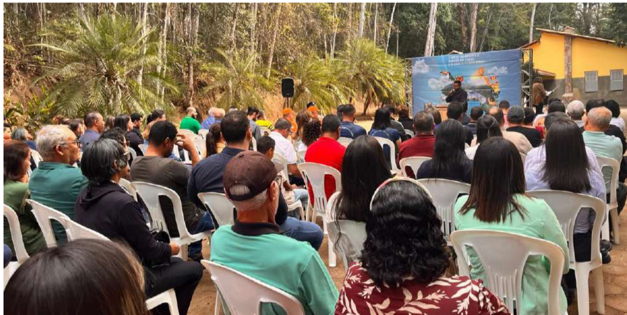
GRANDE público prestigia reabertura de Parque Natural Municipal de Peti

ESTAÇÃO AMBIENTAL VOLTA A RECEBER VISITANTES APÓS INVESTIMENTOS DA PREFEITURA NA REESTRUTURAÇÃO E EXECUÇÃO DE PLANO DE PRESERVAÇÃO