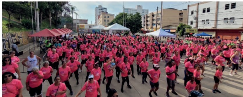
TERCEIRA edição do evento movimentou o último fim de semana em homenagem à mulher

EVENTO EM HOMENAGEM ÀS MULHERES LOTOU PRAÇA DO POVO