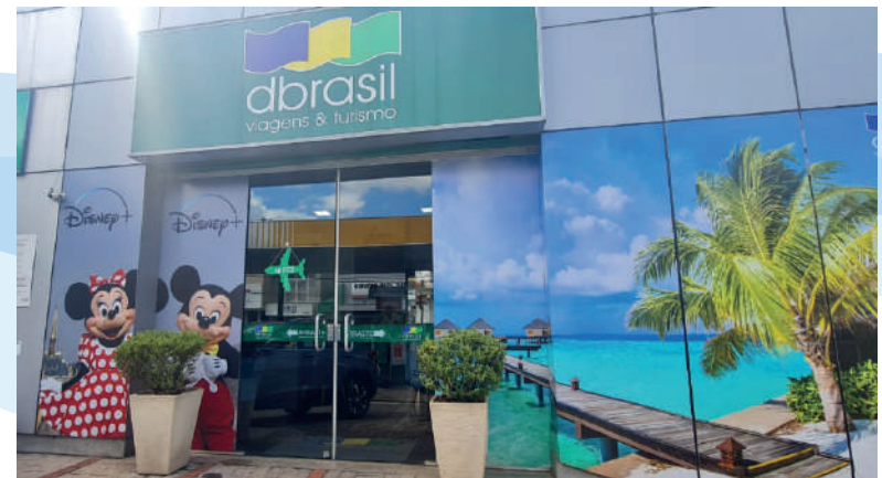
Av. Wilson Alvarenga, 1732 Loja C - Centro - João Monlevade/MG - (31) 3851-7878

Obrigada, Monlevade, por nos acolher e nos apoiar ao longo desses 16 anos. Que a nossa parceria prospere ainda mais, e possamos desbravar juntos um mundo de aventuras emocionantes e momentos memoráveis.