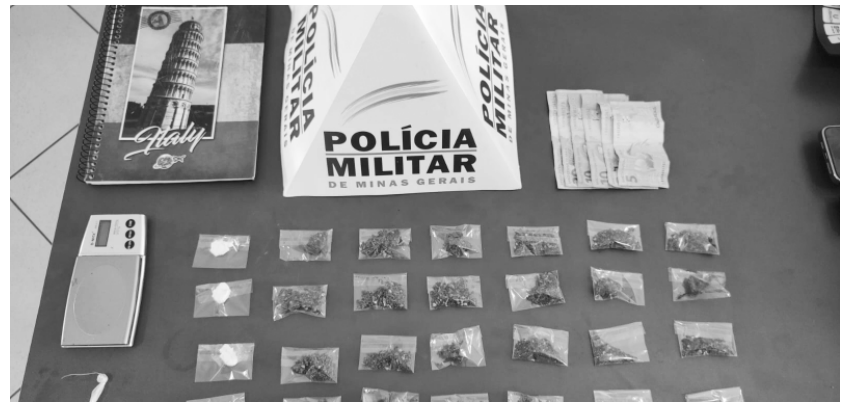
DROGAS foram encontradas no estabelecimento que pertenceria ao autor

Por volta das 10 horas da terça-feira (12), a Polícia Militar esteve na barbearia que pertenceria ao suspeito, na rua Albertino Leão Ferreira, no bairro Planalto. Ali, os militares encontraram 24 buchas de maconha, quatro papéletes de cocaína, duas pedras de crack, uma balança, um caderno com anotações e R$70,00 em dinheiro. As causas da tentativa de homicídio ainda são investigadas e as diligências continuavam até o fim da manhã de ontem (14).