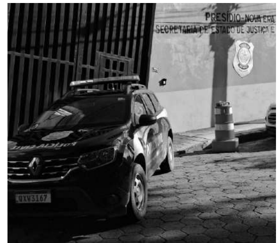
RESIDENTE em imóvel foi preso por furto de energia, que pode render até quatro anos de prisão

A equipe encontrou e prendeu o morador da casa pelo crime de furto de energia elétrica, que pode render de um a quatro anos de prisão, conforme o artigo 155 do Código Penal. Em seguida, ele foi encaminhado à Delegacia de Polícia Civil para os procedimentos legais.