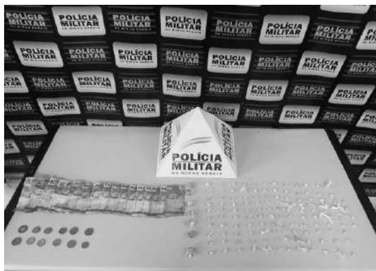
DESCONFIANÇA de policiais motivou abordagem e descoberta das drogas

Os militares decidiram abordá-lo, encontrando 124 pedras de crack, sete buchas de maconha e R$122,85 em dinheiro. Ele foi imediatamente preso e encaminhado à Delegacia de Polícia Civil para as providências legais.