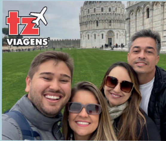
GRUPO durante viagem a Itália no mês de fevereiro

Com a agenda deste ano já fechada, a TZ Viagens abre oficialmente o calendário de viagens em grupo de 2025. O primeiro passeio do próximo ano será em grande estilo: um tour pela Europa contemplando os países da Itália, Mônaco e França no período entre 9 e 17 de janeiro. As inscrições para esse grupo foram abertas oficialmente nesta semana.